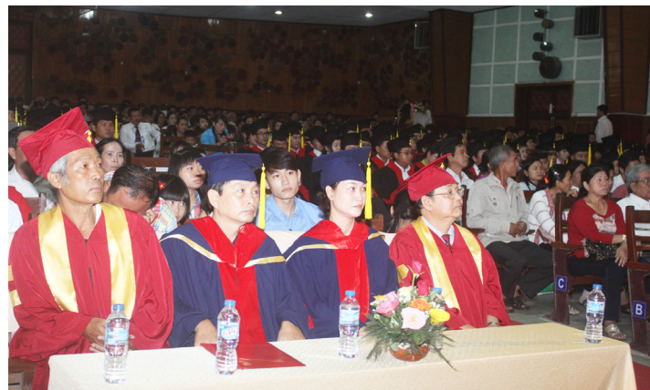
Các Tân Tiến sĩ (áo xanh) trong lễ phục chính tề đội xướng danh trên lễ đài

tạo Sau đại học mà Trường ĐHTC đã đào tạo gồm 291 NCS và 7.232 học viên cao học. Tính đến thời điểm tổ chức trao bằng tiến sĩ, thạc sĩ (đợt 02, năm 2013), số lượng NCS và học viên cao học của Trường đã tốt nghiệp là 45 tiến sĩ và 3.911 thạc sĩ. Hiện tại, có 228 NCS và 3.304 học viên cao học còn đang theo học tại Trường. Sau khi được đào tạo và nhận bằng tốt nghiệp của Trường ĐHTC, đây sẽ là lực lượng cán bộ có trình độ cao góp phần thúc đẩy sự phát triển cho khu vực ĐBSCL nói riêng và cả nước nói chung.