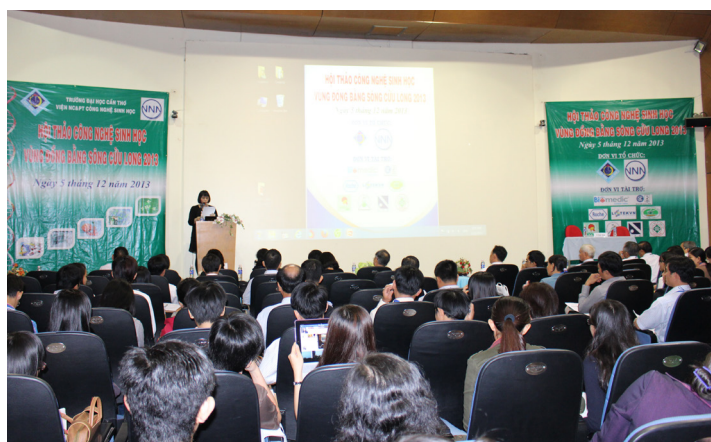
Toàn cảnh khai mạc Hội thảo Công nghệ sinh học vùng Đồng bằng sông Cửu Long 2013

T hực hiện nhiệm vụ đào tạo, nghiên cứu khoa học và chuyển giao công nghệ lĩnh vực công nghệ sinh học phục vụ sự phát triển của vùng ĐBSCL, góp phần vào sự phát triển của cả nước, Viện Nghiên cứu và Phát triển Công nghệ Sinh học-Trường ĐHCT được giao nhiệm vụ tổ chức Hội thảo Công nghệ Sinh học vùng ĐBSCL 2013 nhằm tạo điều kiện cho các nhà khoa học, nhà quản lý và doanh nghiệp có điều kiện trao đổi, chia sẻ các kết quả, các thành tựu nghiên cứu về lĩnh vực công nghệ sinh học. Đồng thời, thông qua Hội thảo, Trường ĐHCT sẽ thu thập được nhiều thông tin hữu ích cho công tác hoạch định chiến lược đào tạo, nghiên