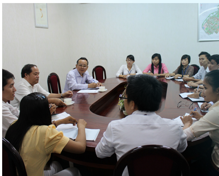
Trao đổi trực tiếp với đại diện sinh viên

Qua đó, đoàn công tác cũng tiến hành khảo sát ý kiến của các em sinh viên nhằm nắm bắt tình hình tư tưởng, những tâm tư, nguyện vọng của các em về những hoạt động hỗ trợ cần thiết giúp các em rèn luyện đạo đức lối sống, tác phong và học tập tốt.