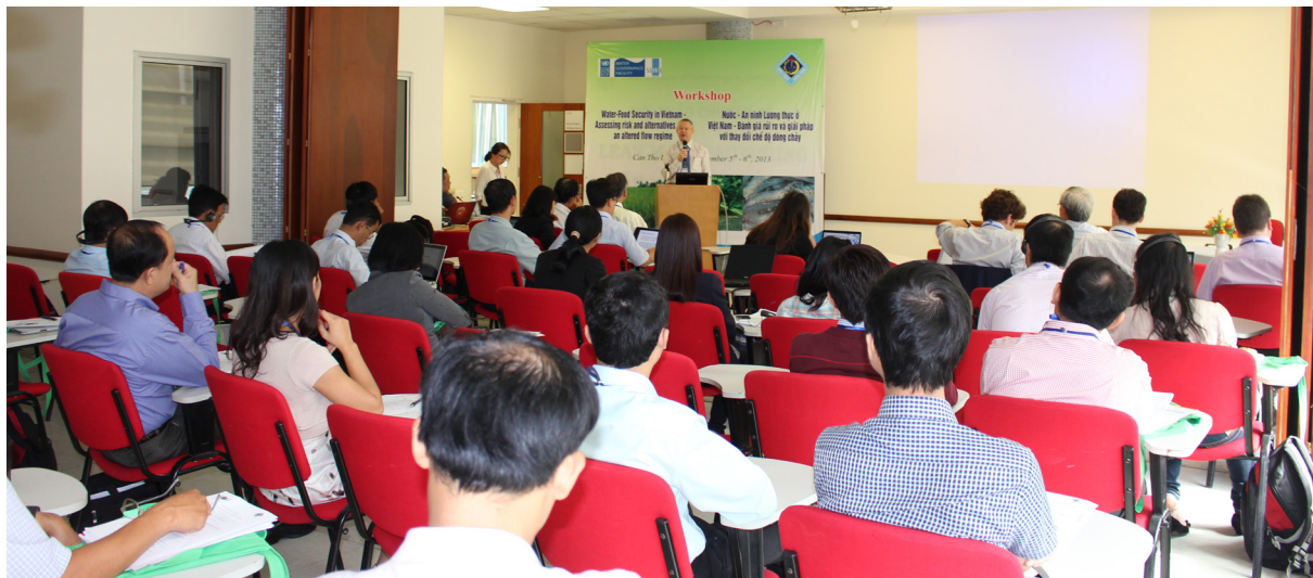
Toàn cảnh Hội thảo “An ninh nước-lương thực ở Việt Nam: đánh giá rủi ro và lựa chọn giải pháp”

Ngày 05/12/2013, tại Trường Đại học Cần Thơ (ĐHCT), Viện Nghiên cứu Phát triển Đồng bằng Sông Cửu Long-Trường ĐHCT, Viện Nước Quốc tế Stockholm và Chương trình Phát triển Liên Hiệp Quốc (UNDP) đã phối hợp tổ chức Hội thảo “An ninh nước-lương thực ở Việt Nam: đánh giá rủi ro và lựa chọn giải pháp”.