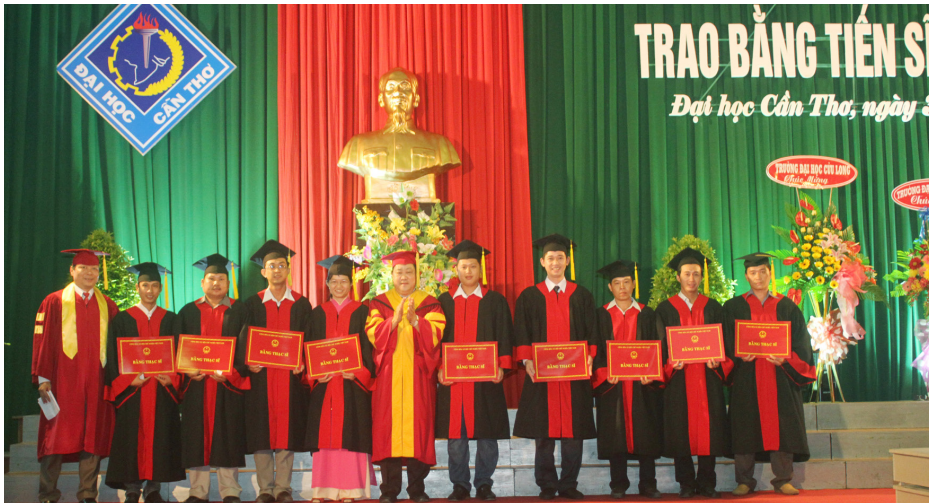
Các Tân Thạc sĩ vui mừng với tấm bằng Thạc sĩ

Ngày 30/11/2013, tại Hội trường Lớn, Trường Đại học Cần Thơ (ĐHCT) đã tổ chức “Lễ Trao bằng Tiến sĩ, Thạc sĩ” đợt 02, năm 2013 cho 03 Nghiên cứu sinh (NCS) và 283 học viên cao học. Tham dự Lễ có đại diện Ban Giám hiệu; đại diện lãnh đạo các khoa, viện có đào tạo bậc Sau đại học; các thầy cô trong Ban giảng huấn của các ngành, chuyên ngành đào tạo Sau đại học cùng 286 tân khoa và thân nhân.