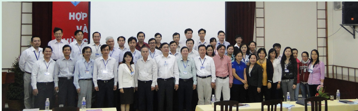
Đại biểu chụp ảnh lưu niệm tại Hội nghị