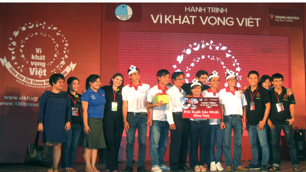
Đội tuyển Trường ĐHTC vui mừng nhận giải “Đội xuất sắc nhất khu vực”

Từ tháng 10/2013, Trung ương Hội Liên hiệp Thanh niên Việt Nam phối hợp cùng Tập đoàn Trung Nguyên tổ chức Cuộc thi Hành trình vì Khát vọng Việt, diễn ra tại 05 khu vực: miền Bắc, miền Trung, Tây Nguyên, Đồng bằng sông Cửu Long (ĐBSCL) và miền Nam nhằm xây dựng và trao tặng tủ sách thành công, vun đắp hoài bão và chí hướng lớn cho thế hệ thanh niên mới với tinh thần “ Người khác làm được thì ta làm được. Nước khác làm được thì Việt Nam ta làm được và làm tốt hơn ”.