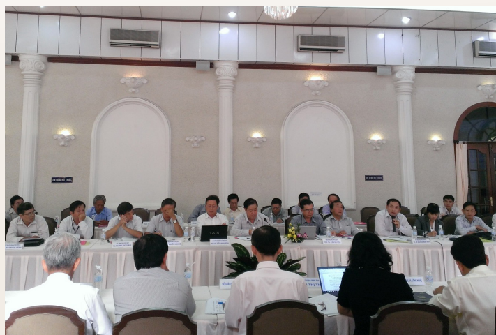
Đoàn đại biểu Trường ĐHTC tham dự Hội nghị

dựng nông thôn mới của chính phủ nói chung và tỉnh Đồng Tháp nói riêng. Trên cơ sở đó, các đại biểu đã tiến hành thảo luận để đưa ra những giải pháp tối ưu và hiệu quả phù hợp với hướng phát triển của tỉnh Đồng Tháp trong thời gian tới.