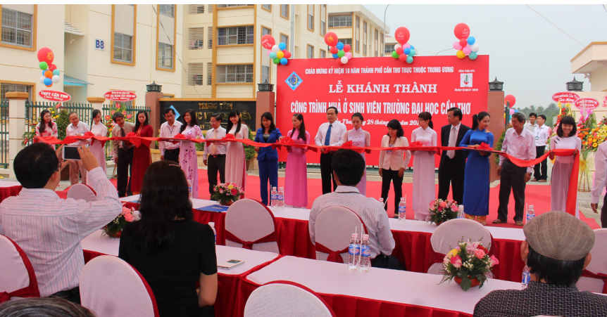
Đại biểu cắt băng khánh thành công trình nhà ở sinh viên