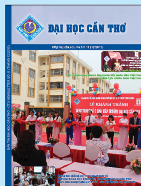
Ảnh bìa 1: Lễ khánh thành công trình nhà ở sinh viên

In tại Công ty Bao bì Vemedim Số lượng: 500 cuốn