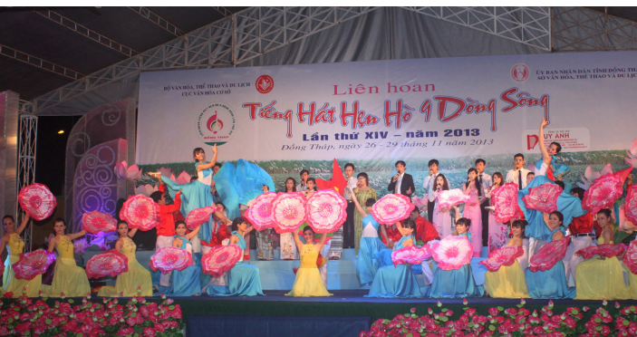
Tiết mục ca múa “Việt Nam tiếng hát trái tim ta” - Huy chương Vàng Liên hoan “Tiếng hát hẹn hò 9 dòng sông” lần thứ XIV năm 2013 tại Đồng Tháp

Từ 26/11 đến 29/11/2013, tại Khu di tích Cù Phó bảng Nguyễn Sinh Sắc (số 137 đường Phạm Hữu Lầu, phường 4, Thành phố Cao Lãnh, tỉnh Đồng Tháp), thân sinh của Chủ tịch Hồ Chí Minh, Đoàn Nghệ thuật Quần chúng Trường Đại học Cần Thơ (ĐHCT) đã tham dự Liên hoan “ Tiếng hát hẹn hò 9 dòng sông ” lần thứ XIV, năm 2013. Với 64 thành viên, Đoàn đã tham gia thi diễn cùng 13 Đoàn Nghệ thuật Quần chúng các tỉnh, thành thuộc khu vực Đồng bằng sông Cửu Long (ĐBSCL).