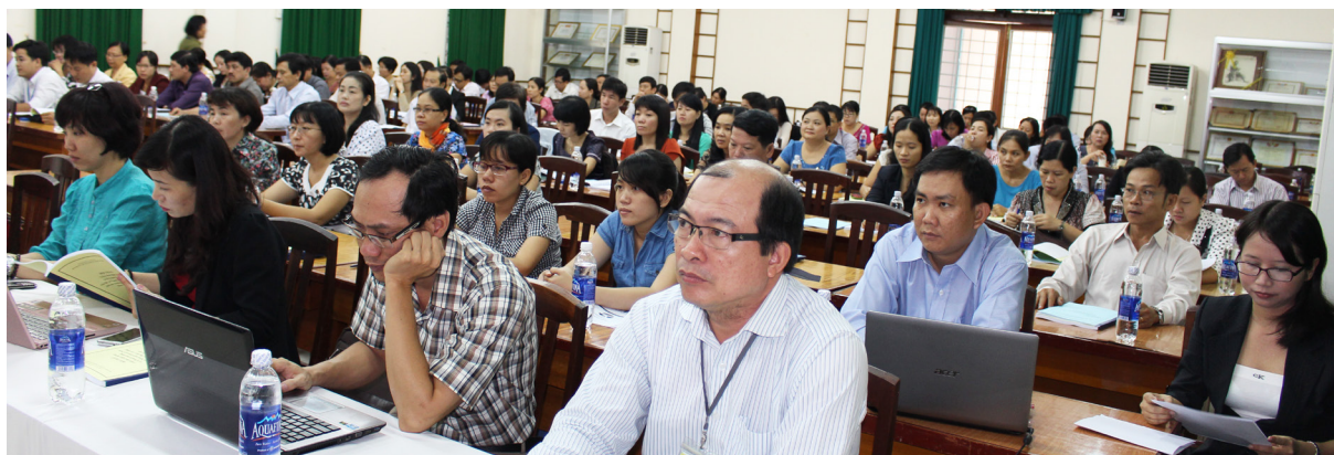
Đại biểu tham dự Hội thảo triển khai chiến lược, kế hoạch hoạt động của Đề án NNQG 2020