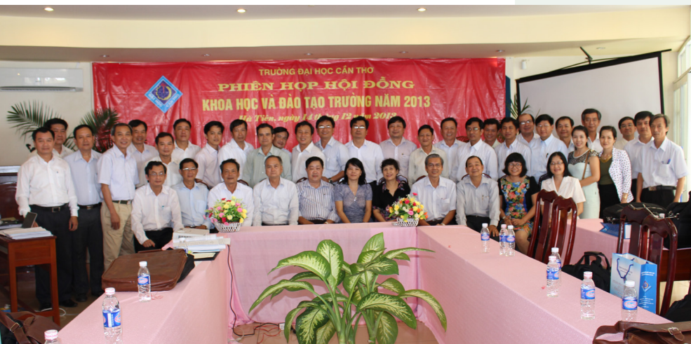
Ảnh lưu niệm đại biểu tại phiên họp lần thứ 02 của Hội đồng Khoa học và Đào tạo Trường ĐHCT

Ngày 14/12/2013, phiên họp lần thứ 02 của Hội đồng Khoa học và Đào tạo Trường Đại học Cần Thơ (ĐHCT) năm 2013 đã diễn ra tại Hà Tiên, Kiên Giang. Tham dự phiên họp có Đảng ủy, Ban Giám hiệu, các thành viên Hội đồng Khoa học và Đào tạo, đại diện lãnh đạo các đơn vị; khách mời đến từ Bộ Giáo dục và Đào tạo, Sở Giáo dục và Đào tạo Thành phố Cần Thơ Đại học Quốc gia Thành phố Hồ Chí Minh, Viện trưởng Viện Lúa Đồng bằng sông Cửu Long.