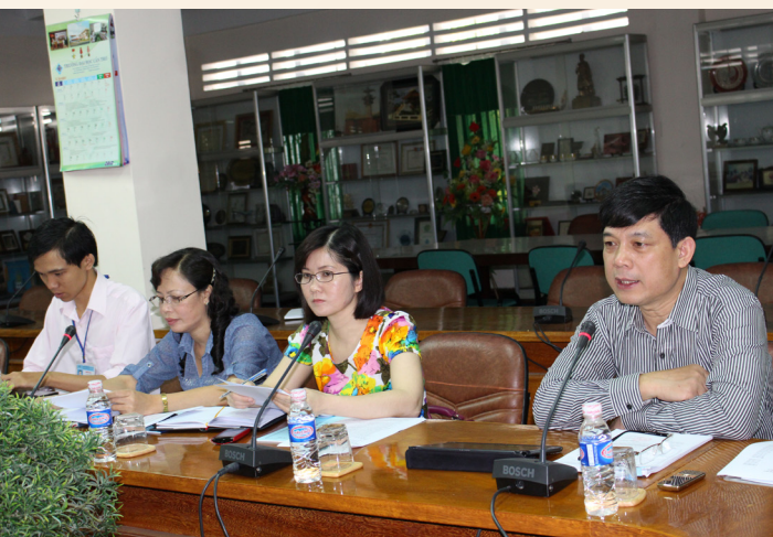
GS.TS. Trần Công Phong (ngoài cùng phải), Chủ tịch CĐGDVN góp ý cho Công đoàn Trường

Đoàn kiểm tra đánh giá cao hoạt động của Công đoàn Trường, đã thực hiện tốt nhiệm vụ và phát huy vai trò của tổ chức Công đoàn trong việc thực hiện chính sách của Nhà nước, chăm lo tốt đời sống CBVC-NLĐ, thực hiện công khai, minh bạch, đảm bảo quy chế dân chủ tại cơ sở, tổ chức triển khai các hoạt động hiệu quả. Qua đó, Đoàn cũng có nhiều ý kiến đóng góp thiết thực góp phần giúp Công đoàn Trường hoạt động ngày càng hiệu quả.